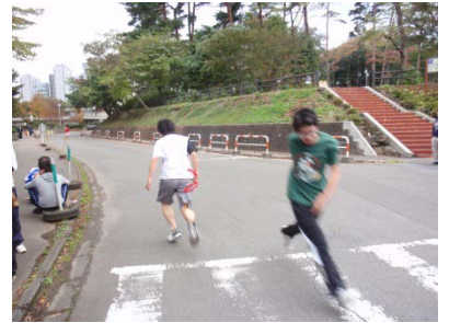
仲間から襷を受け取り、いざコースへ