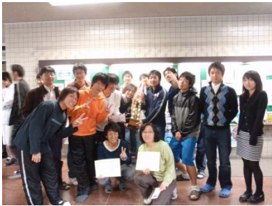
優勝した生命機能解析学Aチーム

「優勝チームのメンバー達と松島ハーフマラソンに出たら、基礎体力が上がって駅伝でもよいタイムが出せました！」