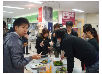
大会後の打ち上げでの一コマ