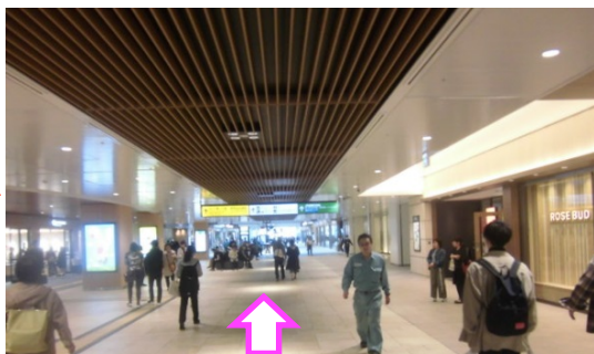
⑦ Under Passをひたすら直進下さい。通過に2分かかります。