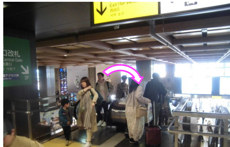
②エスカレーターに乗り3Fから2Fへ移動