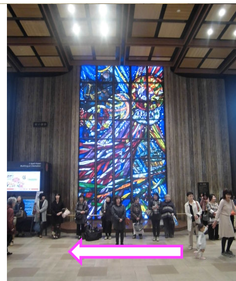
④進行方向に向かって右側に大きな高さ7 mの大きなステンドグラスを通過してください。