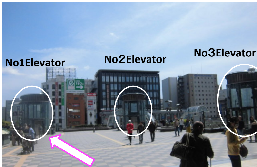
Elevatorが3機あります。⑧ No1 Elevatorで1F Bus Poolに移動ください。