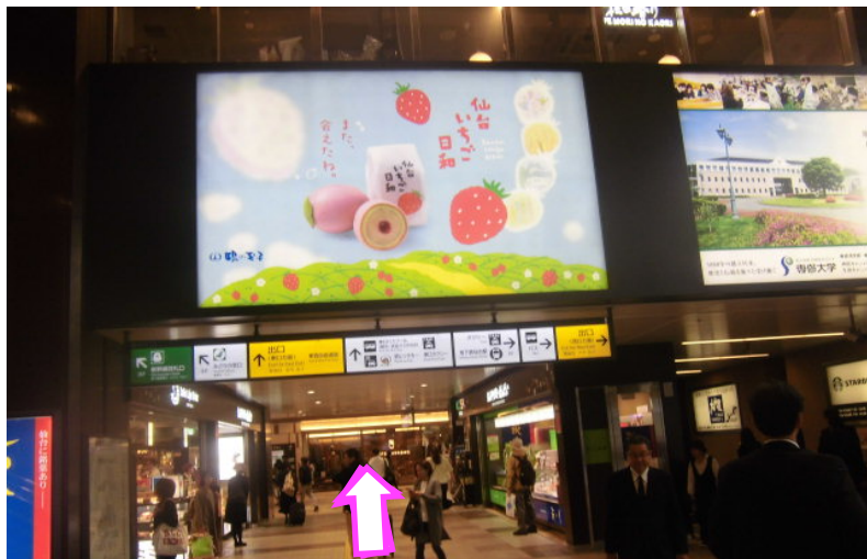
⑤ 仙台いちご日和の大看板を確認。通路を直進下さい。