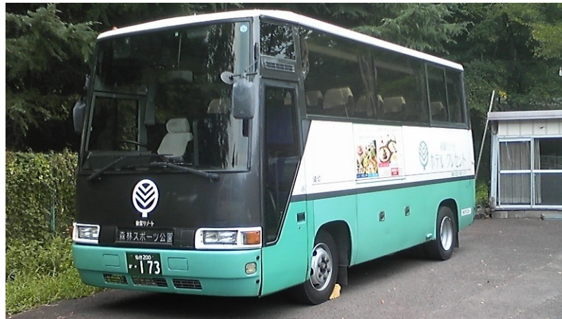
※秋保クレセントのバスは2台を予定しますが、 いずれも同じデザインのバスです。