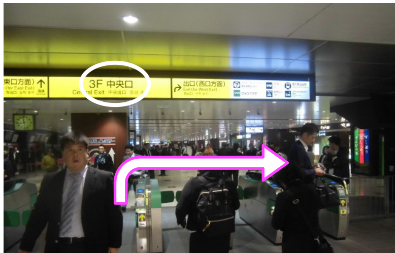
①新幹線中央改札口(3F) 改札を出て、斜め右方向へ30メートル進み、 下りのエスカレーターに乗ってください。