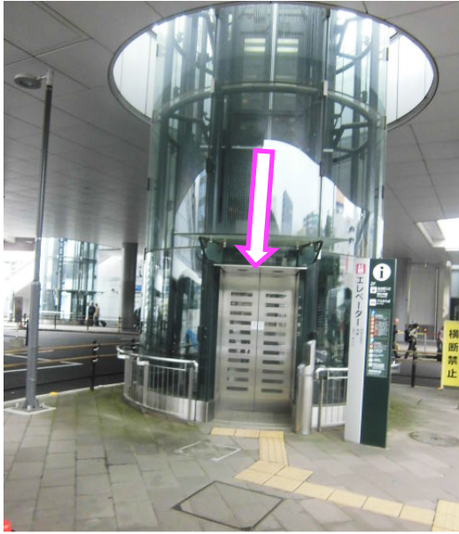
⑨No1Elavatorで1F Bus Pool 到着です。