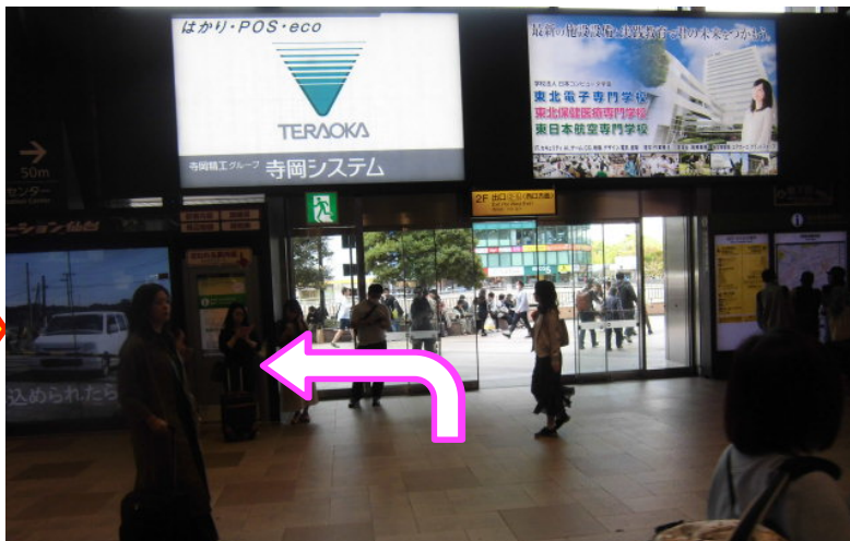
③2Fエレベーター降口 エレベーター降り口の正面看板 「TERAOKA」を確認したら左折下さい。