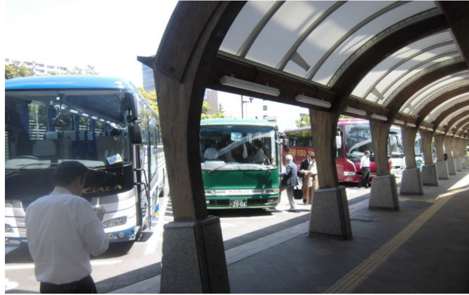
⑩Bus Poolには5台のパーキングレーンがあります。 秋保クレセントのバスにご乗車ください。