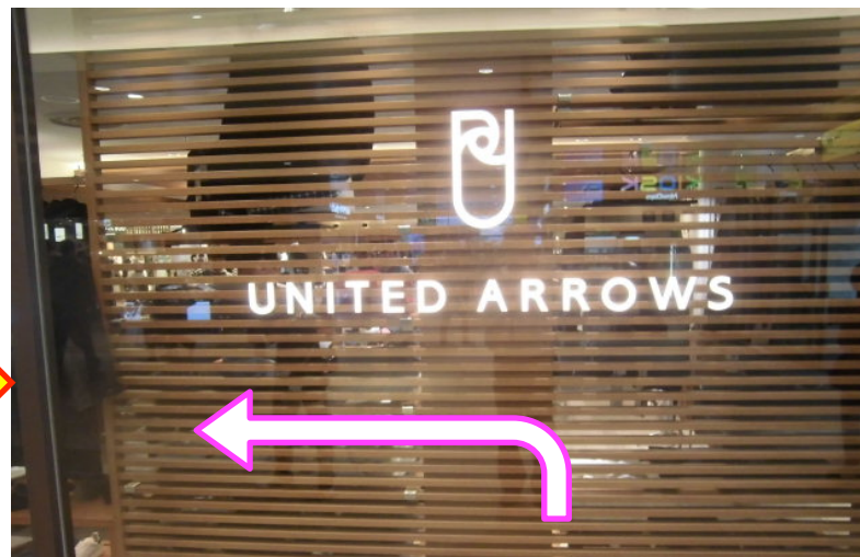
⑥ 突き当りに「UNITED ARROWS」のサインを確認し、左折してください。