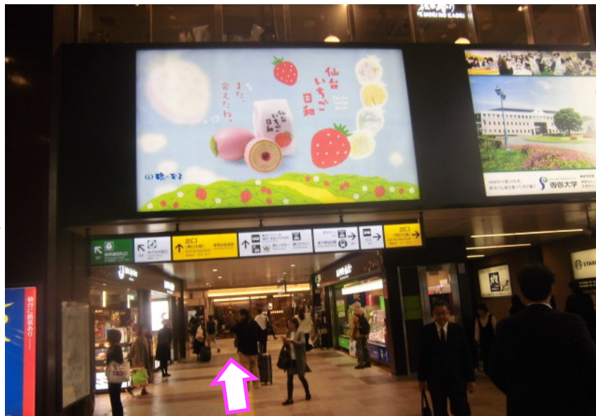
⑮エレベーターを降りると左手に「仙台いちご日和」の大看板あり。通路を直進してください。