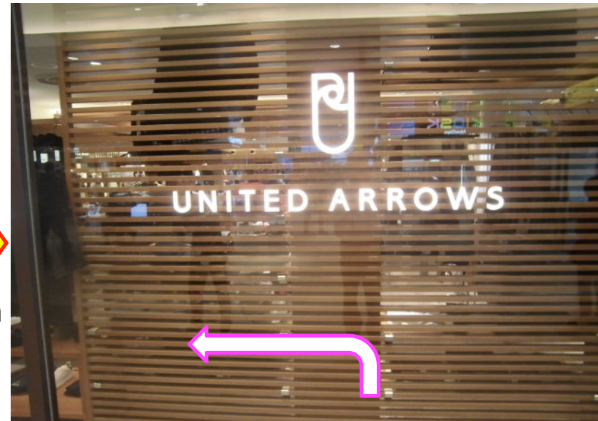
⑯突き当たりに「UNITED ARROWS」のサインを確認し左折してください。