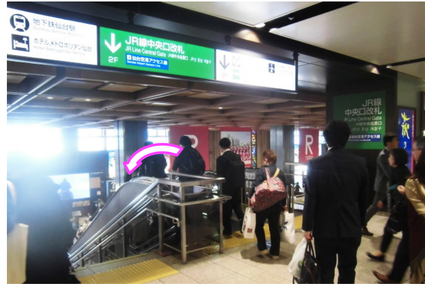
⑫エレベーターで3Fより2Fへ移動