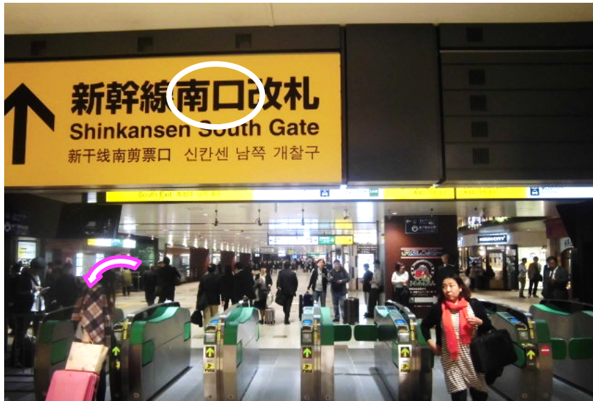
⑪新幹線南口改札(3F)を出て20m直進下さい。